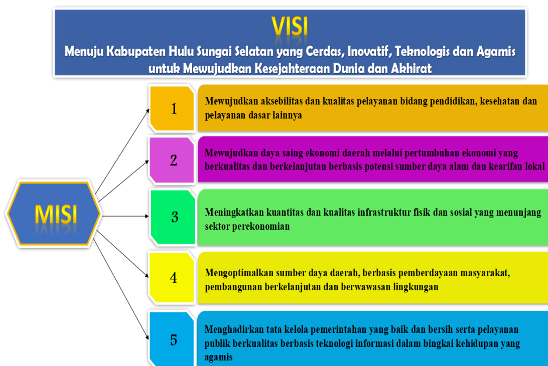
Gambar 3.1 Visi dan Misi RPJMD Kab. Hulu Sungai Selatan Tahun 2018-2023 Sumber: Bappelitbangda Kab. HSS Tahun 2019

Berpedoman pada Peraturan Daerah Nomor 3 Tahun 2019 tentang Rencana Pembangunan Jangka Menengah Daerah Kabupaten Hulu Sungai Selatan Tahun 2018-2023, dengan Visi dan Misi sebagaimana gambar 3.1.